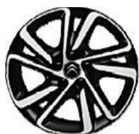
Hliníkový disk SHAMAL 17"