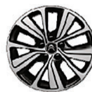
Hliníkový disk AQUILLON 17"