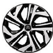
Hliníkový disk ZEPHYR 17"