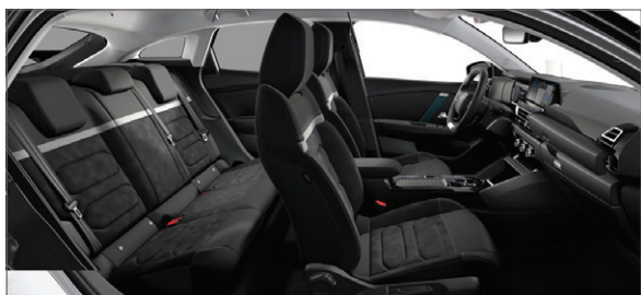
Mix Alcantara šedá / Látka s efektem černé kůže