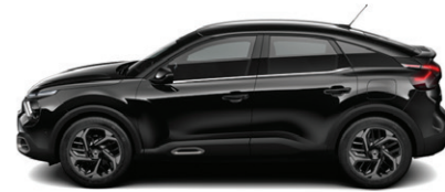
Černá OBSIDIEN (P)

N - Nemetický lak M - Metalický lak P - Perleťový lak P* - Perleťový vícevrstvý lak