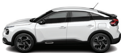
Bílá BANQUISE (N)