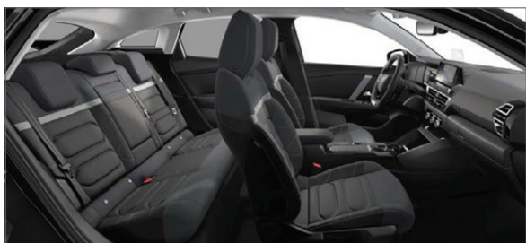
Mix Látka s efektem černé kůže / Látka šedá