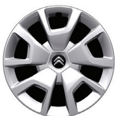
Okrasný kryt SPRING 16"