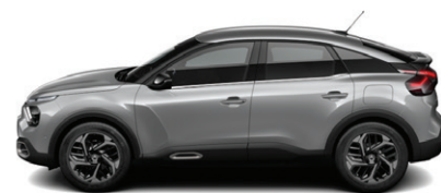
Šedá ARTENSE (M)