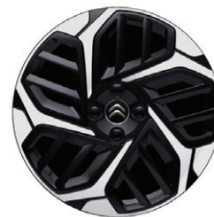
Hliníkový disk AEROBLADE 18" s výbrusem