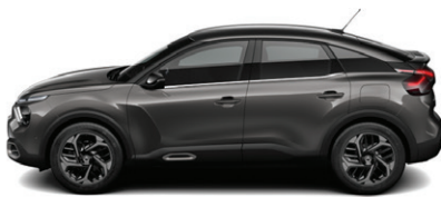
Šedá PLATINIUM (M)