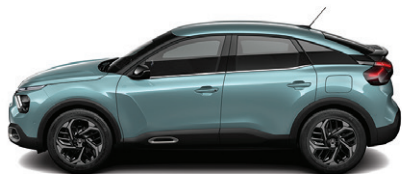
Modrá ICELAND (P)