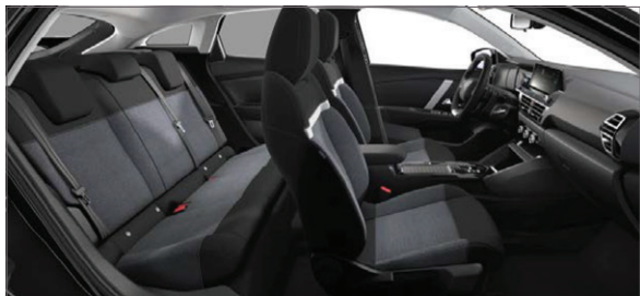
Mix Látka Meanwhile / Látka černá