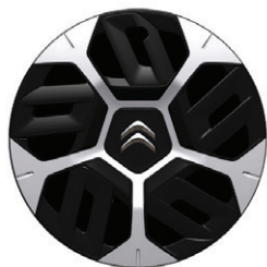
Okrasný kryt AEROTHECH 18"