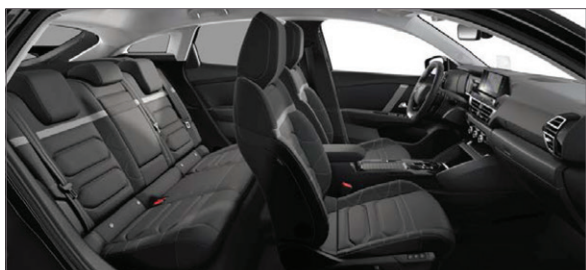
Mix Kůže Siena černá / Látka s efektem černé kůže