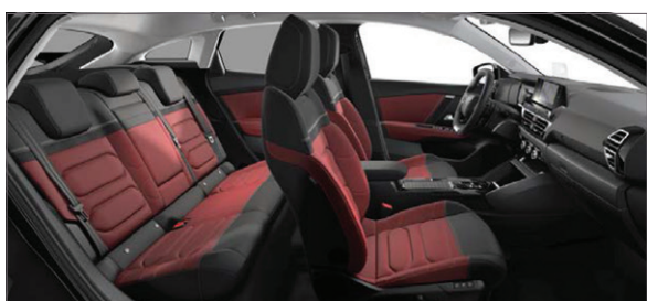
Mix Kůže Siena červená / Látka s efektem černé kůže