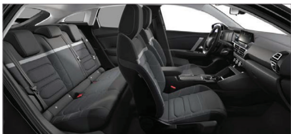
Mix Látka Chevrons šedá / Látka černá s efektem kůže