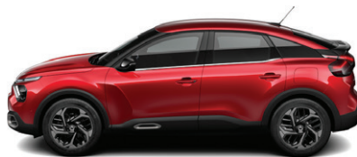
Červená ELIXIR (P*)