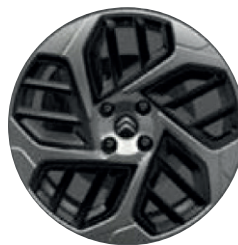
Hliníkový disk AEROBLADE 18"